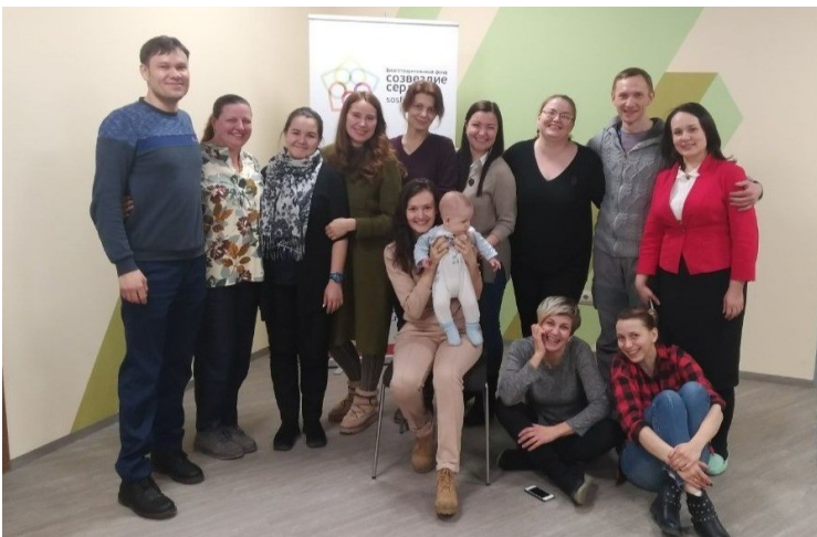
Команда фонда «Созвездие сердец»